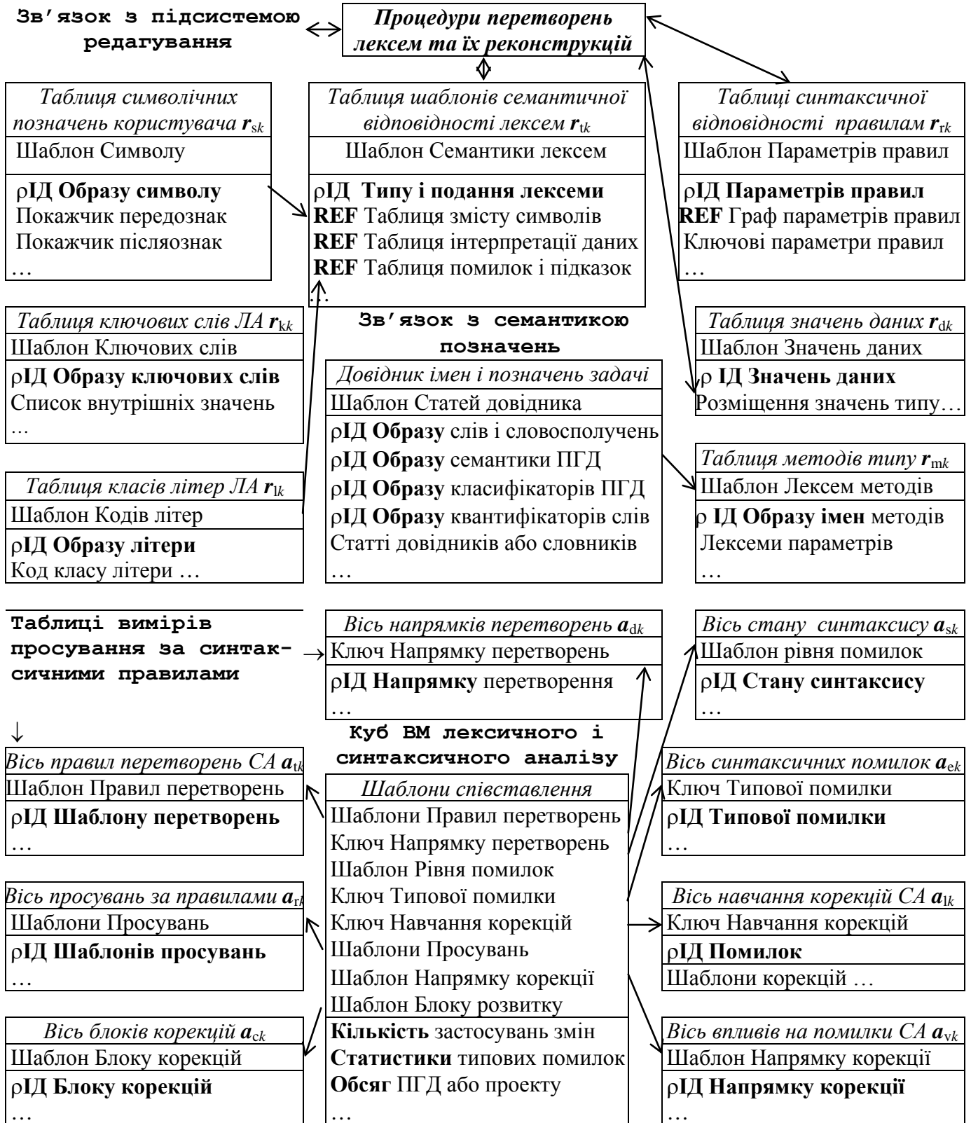
Рис. 1. Узагальнена інформаційно-логічна структура БЗ перетворень парсера САП

них на різних мовах програмування і моделювання апаратури, перетворених в єдину форму внутрішнього подання.