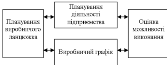
Рис. 2. Структура моделі APS

APS системи звичайно є композицією різних процесів, які використовують ті ж самі підходи до планування, але із різними обмеженнями та вхідними даними [5]. Структуру моделі APS зображено на рис. 2.